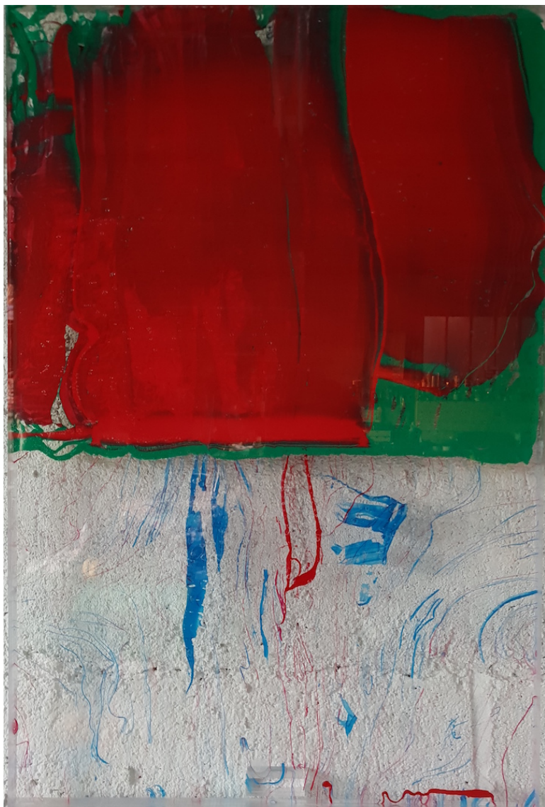
PARK BYUNG-HOON Transparence 164342-1 , 2019 Acrylique sur Plexiglas 60 x 40 cm Pièce unique N° INV byup_069