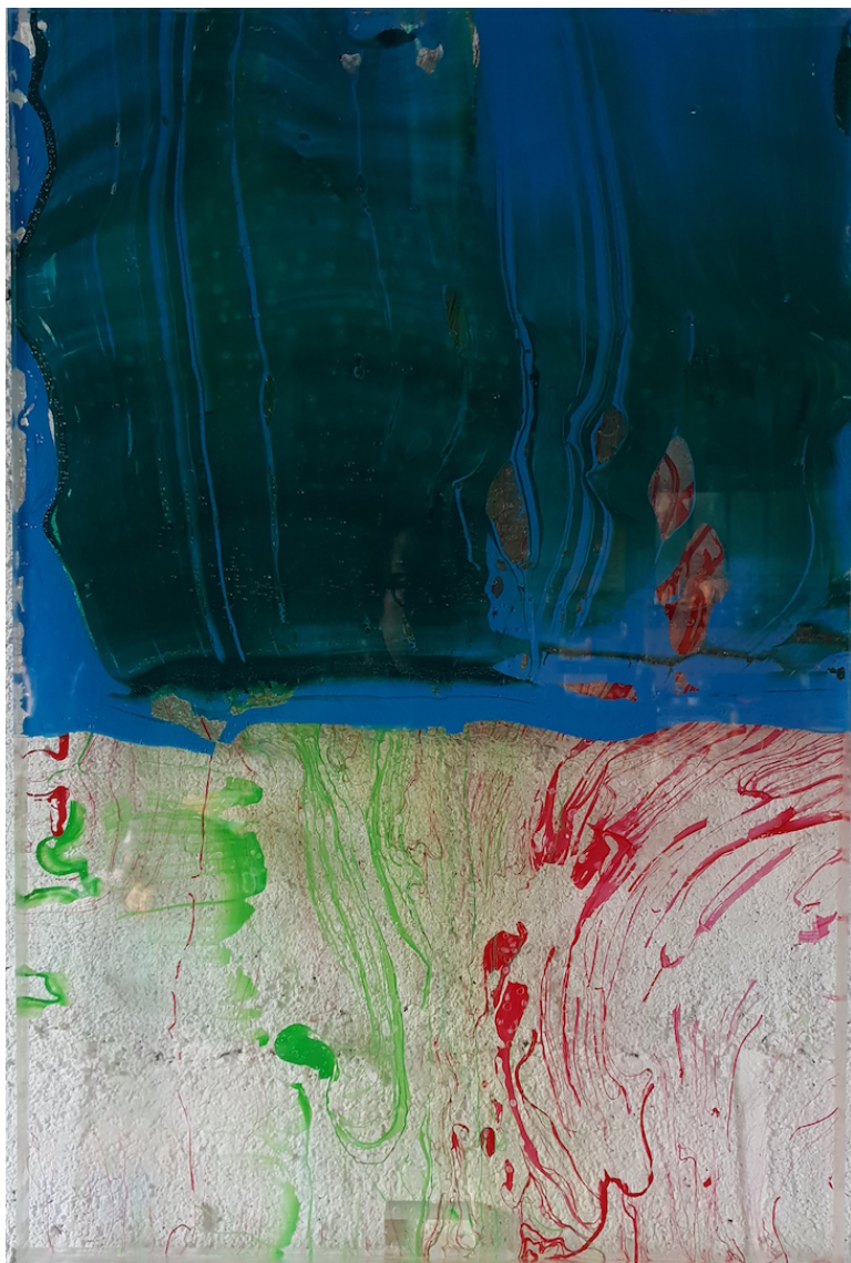
PARK BYUNG-HOON Transparence 164058 , 2019 Acrylique sur Plexiglas 60 x 40 cm Pièce unique N° INV byup_068