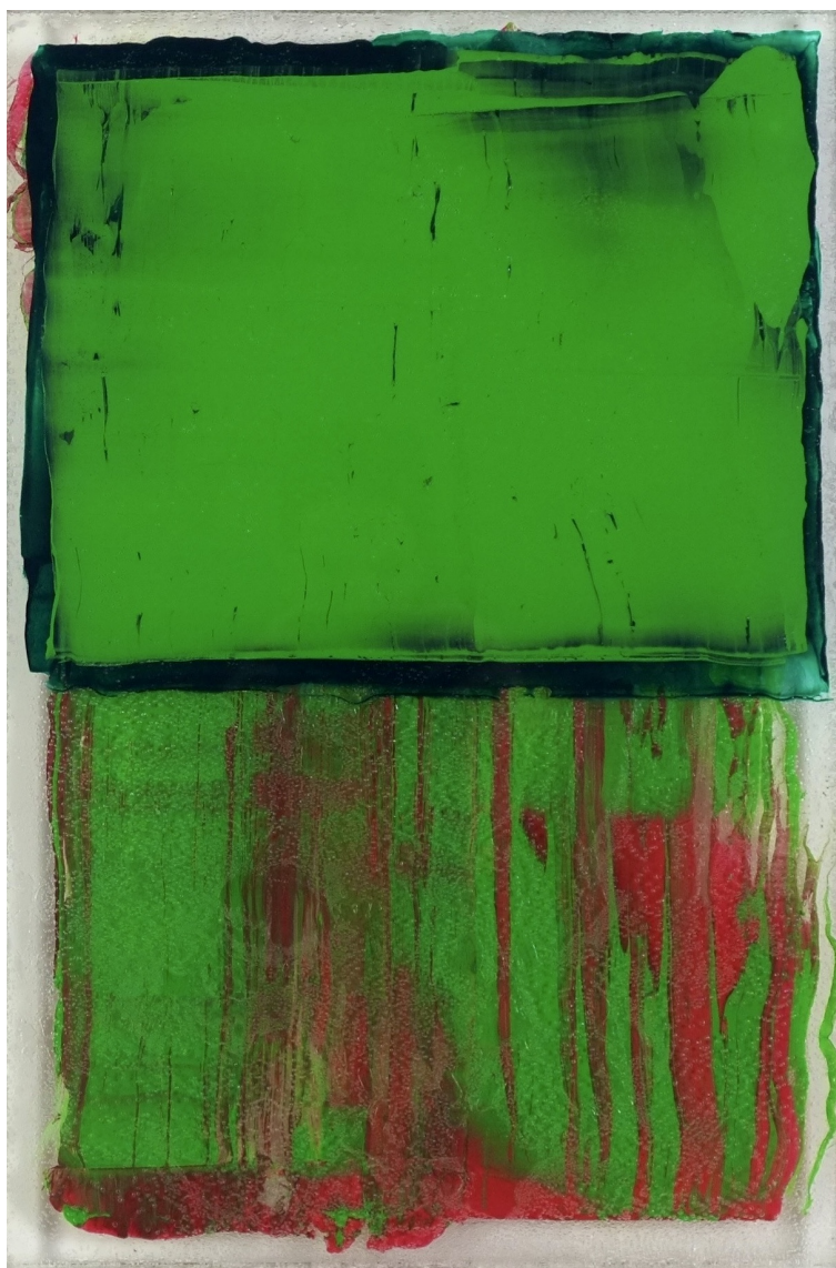
PARK BYUNG-HOON Transparence 22-3, 2022 Acrylique sur Plexiglas 60 x 40 cm Pièce unique Signé N° INV byup_104