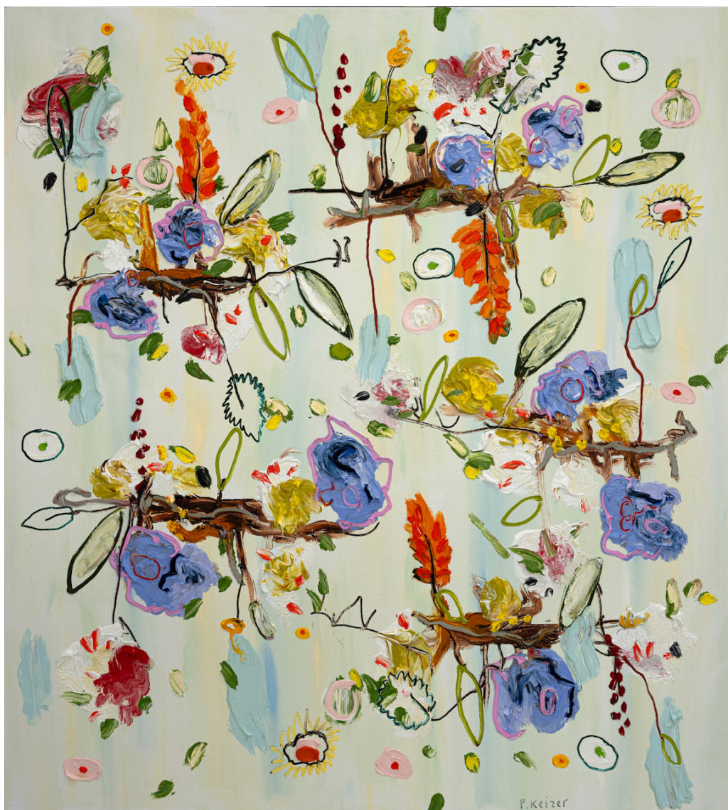
PETER KEIZER After the rain, 2024 Huile sur toile 124 x 112 cm Pièce unique Signé N° INV keip_578