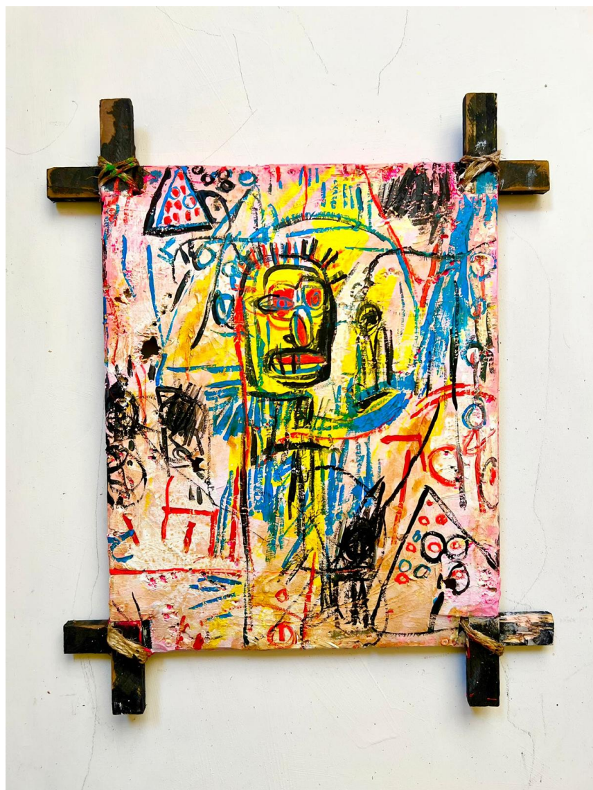
JORIS GHILINI Hamburger, 2024 Acrylique sur bois 58 x 49 x 9 cm Pièce unique Signé N° INV ghij_041