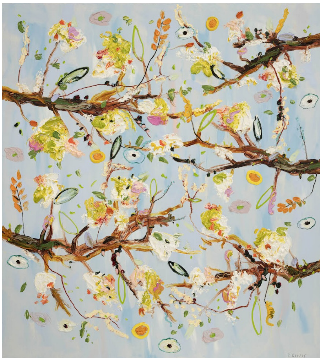
PETER KEIZER Time circles, 2024 Huile sur toile 124 x 112 cm Pièce unique Signé N° INV keip_568