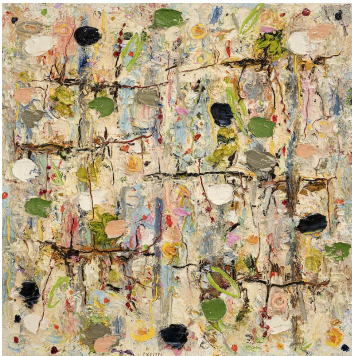
PETER KEIZER More is more, 2024 Huile sur toile 120 x 120 cm Pièce unique Signé N° INV keip_567