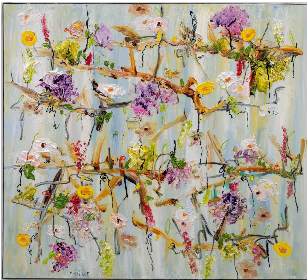
PETER KEIZER Dwars , 2025 Huile sur toile 112 x 124 cm Pièce unique Signé N° INV keip_596